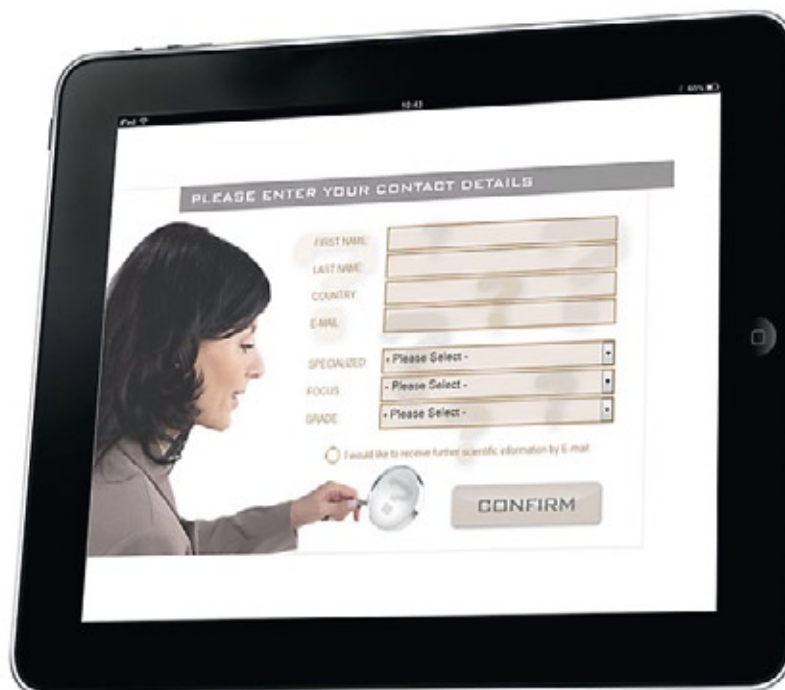
Schnelle Erfassung aller relevanten Daten in einem Schritt per Tablet

Die schnelle Erfassung und der flexibler Datenabgleich ohne Medienbruch haben zu einer Verbesserung in der Qualität und Quantität von Messekontakten geführt. Gleichzeitig ermöglicht die Umsetzung es dem Unternehmen sich modern und zukunftsgerichtet zu präsentieren.