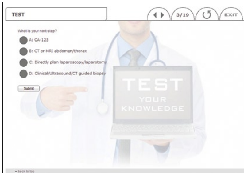
Integriertes Wissensquiz: „Lernen auf Knopfdruck“